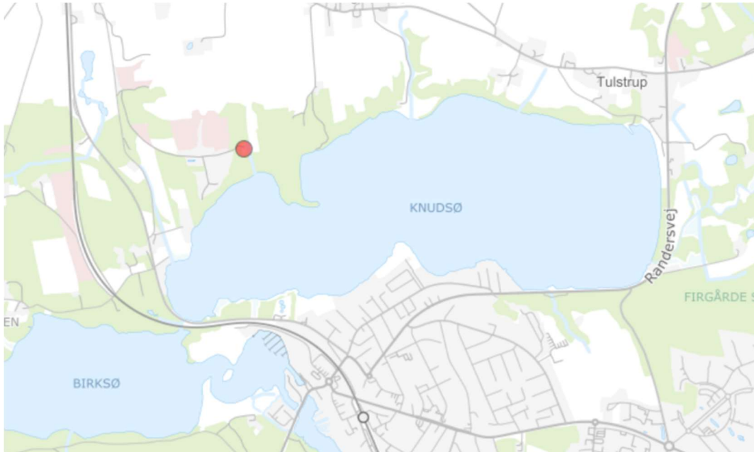
Kort 1

Beliggenheden af ejendommen fremgår af nedenstående oversigtskort, vist med rød prik.